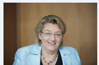
Kordula Schulz-Asche, MdB Bündnis 90/Die Grünen